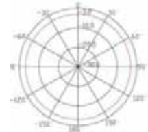
Ancho de haz horizontal